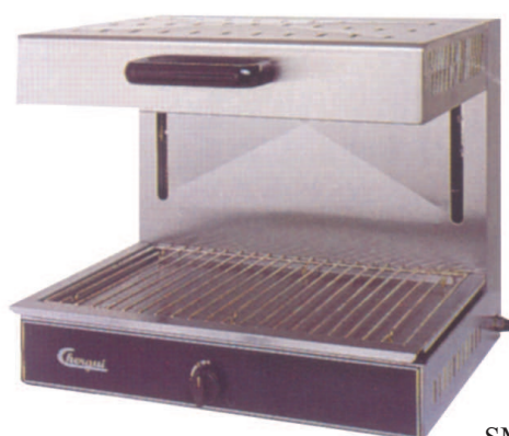
SMG 60 (gas)