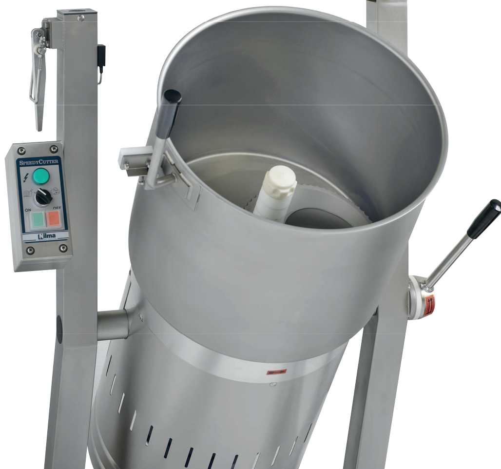
Detalle cierre tapa motor autofrenante

Nota: Los tiempos de elaboración y las cantidades de producción indicadas en la tabla, pueden variar dependiendo de la calidad de los productos, de la temperatura que tengan, del troceado y del grado de elaboración que se desee.