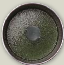
Aceite de hierbas