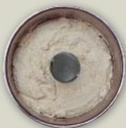
Mousse de pescado